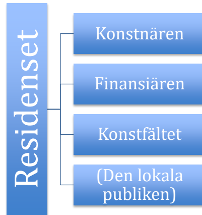
Figur 1: Residensverksamhetens parter och genomslagskraft

Följande beskriver konstnärens, finansiärens, beslutsfattarens och konstfältets förväntningar på residensverksamheten: 7